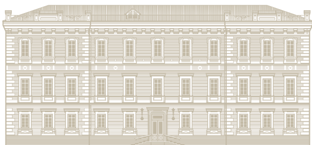
Президія Національної академії наук України

«Ви знаєте, як мені дорога Україна і як глибоко українське відродження проникає в мій національний і власний світогляд...» , — писав науковець у своїх мемуарах.