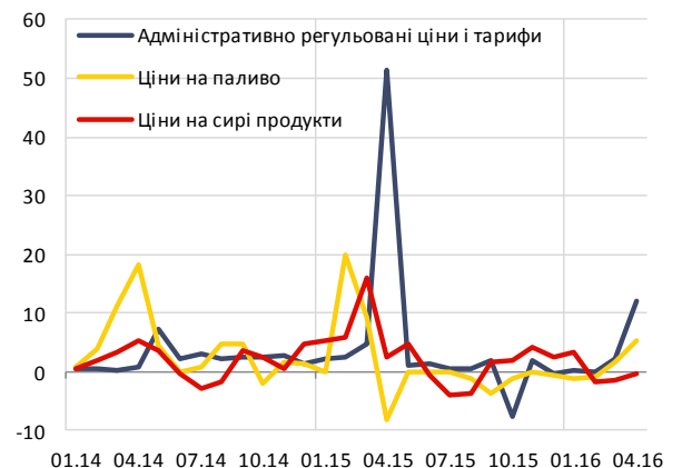
Основні компоненти небазового ІСЦ, % місячна зміна