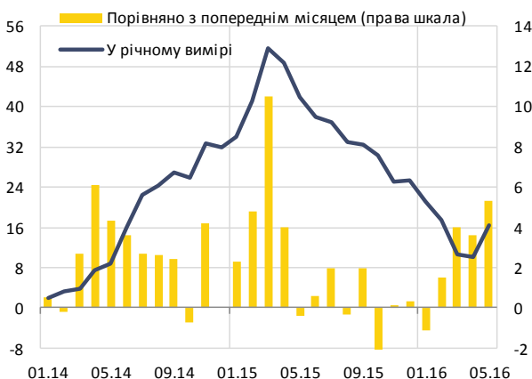
Зміна індексу цін виробників, %