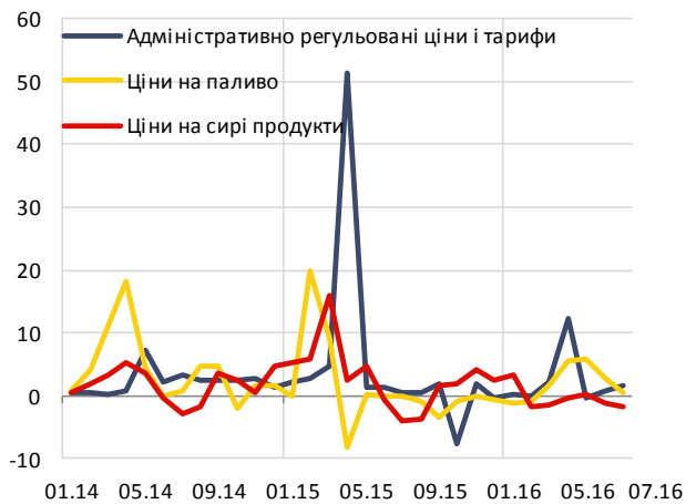
Основні компоненти небазового ІСЦ, % місячна зміна