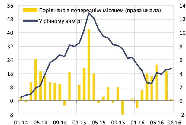
Зміна індексу цін виробників, %

Крім того, знизилася ціна в металургійному виробництві та хімічній промисловості. Перше пояснюється зниженням цін у попередній ланці виробничого процесу, а саме в добуванні металевих руд у минулі місяці. Друге зумовлювалося як зниженням світових цін на добрива, яке триває з червня поточного року, так і значною пропозицією імпортованої продукції на вітчизняному ринку. Ціни в харчовій промисловості в цілому не змінилися.