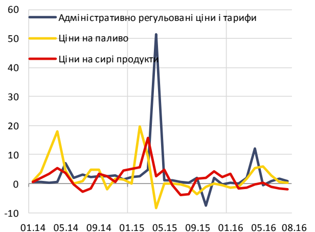
Основні компоненти небазового ІСЦ, % місячна зміна