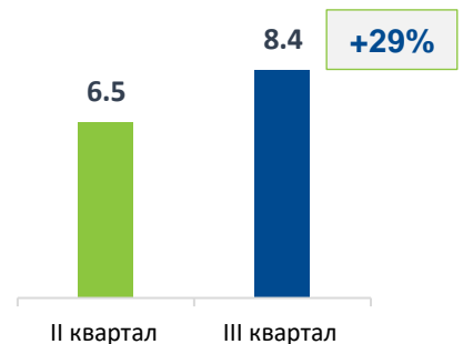
Кількість успішних ідентифікацій за II та III квартал 2022р., млн шт.

Загальна кількість успішних запитів через Систему BankID НБУ за III квартал 2022 року склала 8,4 млн запитів , що на 29% більше, ніж у II кварталі цього року.