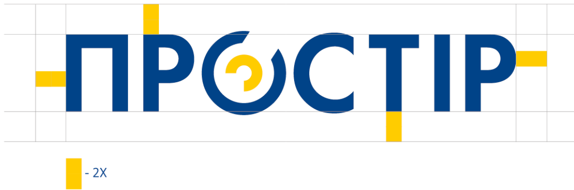
Малюнок 4. Охоронне поле знаку ПРОСТІР