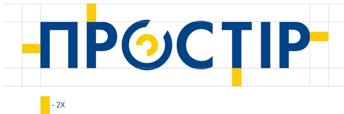
Малюнок 4. Охоронне поле знаку ПРОСТІР