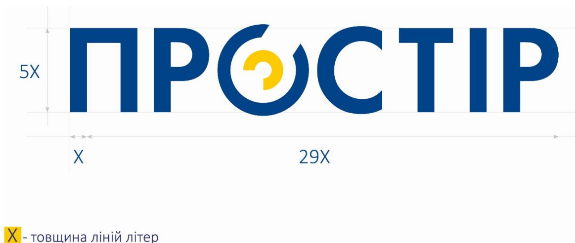
Малюнок 3. Геометрія та пропорції знаку ПРОСТІР