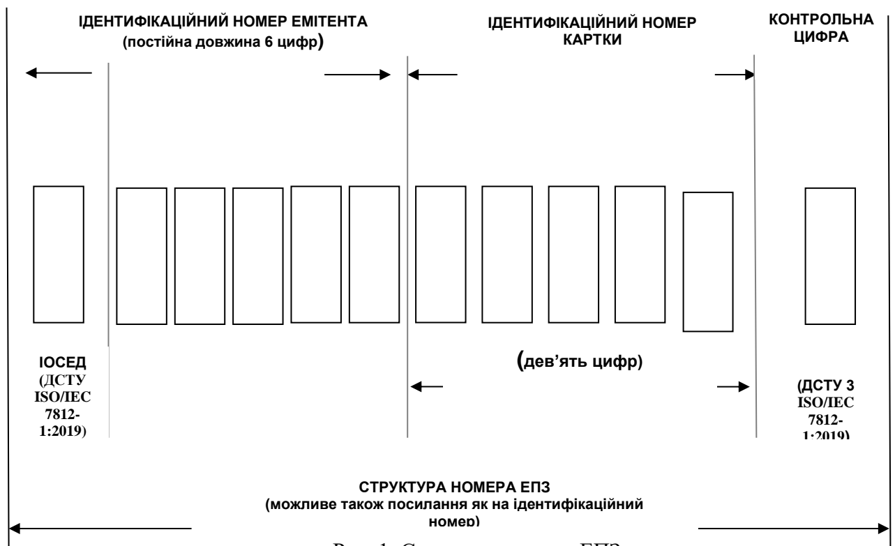
Рис. 1 Структура номеру ЕПЗ

в) контрольна цифра, обчислення якої здійснюється за формулою Люна (остання цифра номеру ЕПЗ).