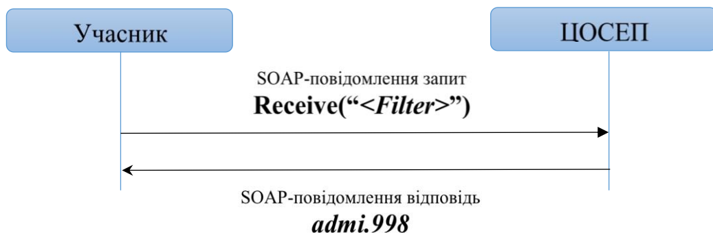
Рис. 1. Схема обміну повідомленнями

Учасник викликає сервіс ЦОСЕП та передає SOAP-повідомлення – запит на отримання інформації від ЦОСЕП. Для цього використовується операція Receive з параметром Filter , який визначає тип (структуру) даних, що необхідно надати Учаснику (докладно описано у документі «Технологія і формати» пункт «Бізнес-сценарій 2. Запит на отримання фінансової інформації»). У відповідь на цей запит ЦОСЕП надає Учаснику SOAP-повідомлення – відповідь, яке містить повідомлення ISO 20022 admi.998 з даними, тип яких було зазначено у параметрі Filter запиту.