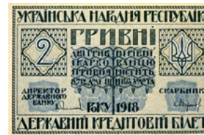
Державний кредитовий білет УНР авторства В. Кричевського. (1918)

Оформив понад три десятки театральних постановок і кінофільмів, у тому числі славетний фільм "Звенигора" (1927) режисера Олександра Довженка.