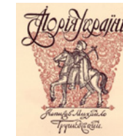
На замовлення М. Грушевського оформив "Ілюстровану історію України".

На жаль, пам'ять про Василя Кричевського, як і про багатьох інших постатей, намагалася знищити радянська влада. Проте вони існували для тих, хто з ризиком для життя беріг їхні твори в Україні. Сьогодні ми боремося за те, щоб наша історія повернулася із забуття та була передана наступним поколінням.