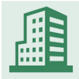
ПрАТ «АК «Київводоканал»